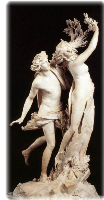
Art-Bernini-Apollo & Daphne TB - Gian Lorenzo Bernini (1598-1680)

« Le corps en mouvement. Les mouvements du corps. Émotions et passions dans la création artistique et littéraire ».