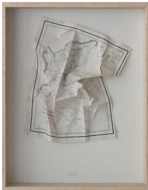
Lina Espinosa. Relieve , 2013 Mapa arrugado sobre cartón

ERIMIT - Equipe de Recherche Interlangues « Mémoires, Identités, Territoires » CRINI - Centre de Recherche sur les Identités Nationales et l'Interculturalité