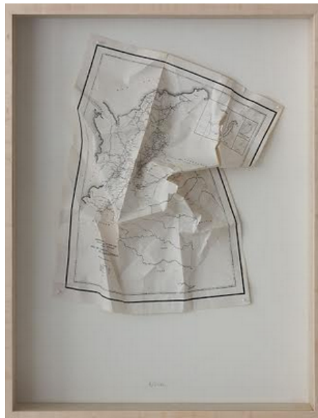
Lina Espinosa. Relieve , 2013 Mapa arrugado sobre cartón

ERIMIT - Equipe de Recherche Interlangues « Mémoires, Identités, Territoires » CRINI - Centre de Recherche sur les Identités Nationales et l'Interculturalité