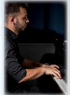
Giambartolo Porretta Pianiste