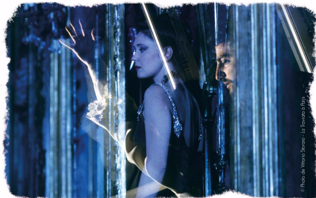
La Traviata à Paris

En partenariat avec le Centre de Recherche L'AMo (L'Ancien, le Moderne) de l'Université de Nantes et avec le soutien de Nantes Métropole, de l'Institut Universitaire de France, du Cinéma Katorza et du Château de Goulaine.